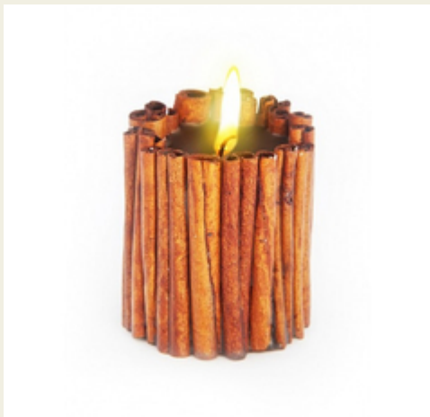
Свеча-эко ручной работы MAGIC LOVE с палочками корицы и эфирными маслами корицы и базилика

Свеча декорирована натуральными коричневыми палочками. При горении она источает аромат корицы и базилика. Такая композиция применяется для привлечения удачи, процветания, успеха и любви. Диаметр 8 см, высота 10 см Производитель: Россия.