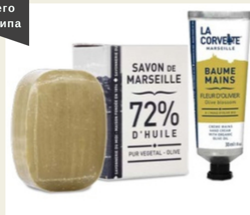
Набор "Мини-Марсель": традиционное мыло (50г) и крем для рук с оливковым биомаслом (30 г)

Превосходный набор с натуральным марсельским мылом на оливковом масле и крем для рук с биомаслом "Цветок оливкового дерева". Косметика по стандарту ECOCERT. Производитель: Франция