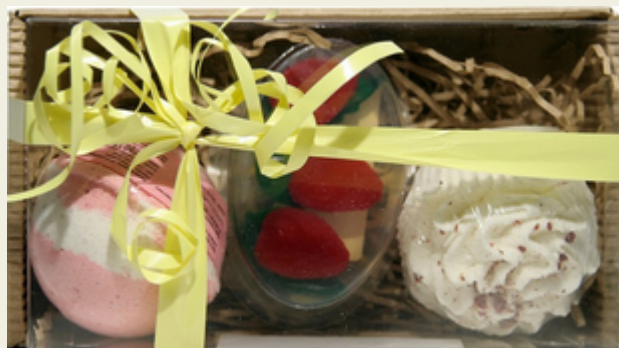
Набор подарочный НАСЛАЖДЕНИЕ

Настоящее лакомство для гурманов. В наборе твердая пена для ванн в виде оригинального десерта, бурлящий шарик для ванн, мыло ручной работы с натуральными маслами.