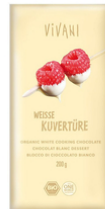
Глазурь из белого шоколада "Белый кувертюр", 30% 200 гр, Vivani

Органическая шоколадная глазурь с экстрактом Бурбонской ванили. Настоящий терпкий вкус и аромат натурального десерта из какао-бобов, какао-масла и нежность молока. Идеальное дополнение к мороженому, пралине, муссу или щербету. Или как самостоятельное лакомство