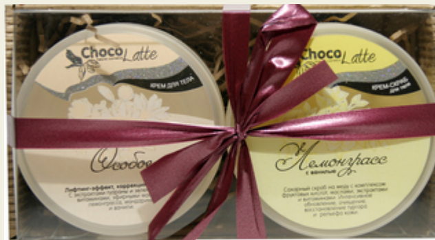
Набор подарочный №12 для тела ЛЕМОНГРАСС

В состав входят: крем-скраб сахарный для тела "Конфитюр Лемонграсс" с ванилью на меду с комплексом масел и фруктовых кислот. Крем-суфле для глубокого увлажнения и питания. Плотный крем с ароматом пряной ванили и лемонграссом. Содержит экстракт гуараны и зеленого кофе.