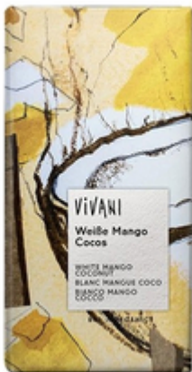
Белый шоколад с манго и кокосом 80 гр, Vivani

Органический шоколад с утонченным вкусом для настоящих гурманов. Белый шоколад в сочетании с легкой фруктовой свежестью кусочков манго и мягким вкусом кокоса. Искушение, которому сложно противостоять!