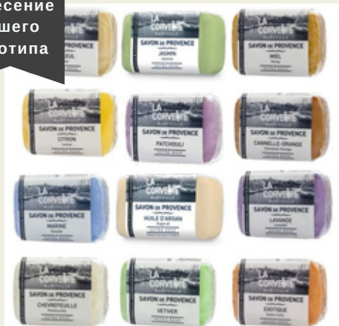
Подарочный набор 12 марсельских мыл "Марсельская палитра"

Легендарное марсельское мыло с натуральными маслами в прекрасном ассорти ароматов и уходовых свойств. Мыло с натуральной рецептурой по стандарту ECOCERT. Производитель: Франция