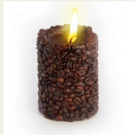
Свеча-эко ручной работы COFFEE с зернами и ароматом кофе

Декоративная свеча с оболочкой из обжаренных натуральных кофейных зерен. Аромат кофе повышает устойчивость к стрессам, улучшает самочувствие, бодрит, стимулирует мозговую активность. Приятный сюрприз для кофеманов! Производитель: Россия