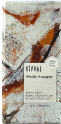
Белый хрустящий шоколад 100 гр, Vivani

Органический шоколад от лучших швейцарских шоколатье не содержит лецитина и белого сахара. Самые высокие требования к компонентам позволяют предложить шоколад с безупречным стандартом качества. Яркий вкус, аромат какао-бобов и хрустящая текстура.