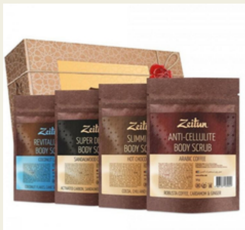
Подарочный набор "Идеальное тело" 4 мини-скраба, Zeiton

Набор из 4 кофейных мини-скрабов в красивой упаковке "Антицеллюлитный", "Моделирующий", "Омолаживающий", "Супер-детокс" Производитель: Россия