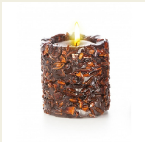
Свеча-эко ручной работы EASY с дробленой скорлупой аниса

Эффектная дизайнерская свеча ручной работы украшена душистым перцем и дробленным анисом. В состав входят эфирные масла аниса и корицы. Эти пряные ароматы моментально поднимают настроение, вдохновляют на творчество и позитивные мысли. Диаметр: 8 см. Высота: 8 см. Производитель: Россия