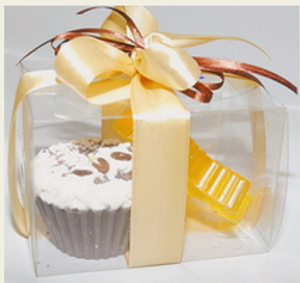
ChocoLatte Набор подарочный LOVE

Милый подарочный набор из природных компонентов. Мыло ручной работы с содержанием 100% натуральных масел и свеча hand made в виде аппетитного десерта. Декор - атласные ленты.